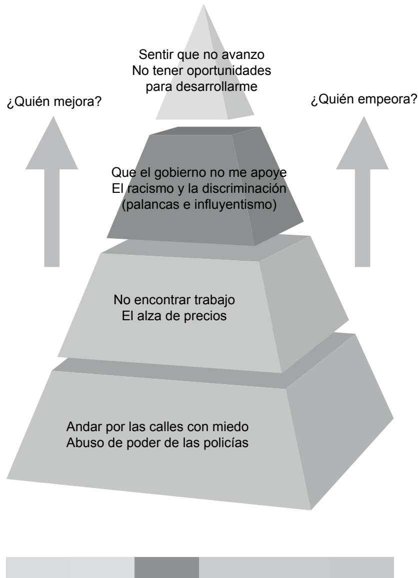
Figura II: Lo que más molesta