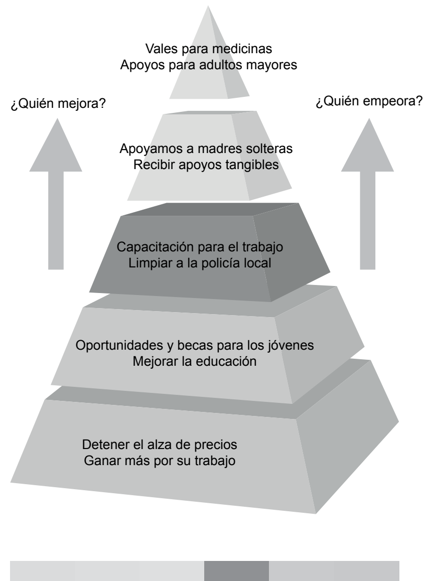
Figura I: Lo que más importa

“ Apoyos para adultos mayores ”: 13% entre la población adulta y sólo 6% entre jóvenes.